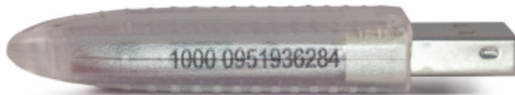
Рутокен S 64КБ