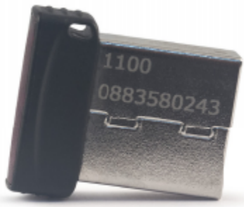
Рутокен ЭЦП 2.0 micro